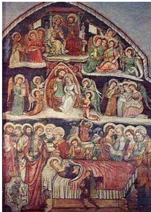
Affresco della Dormitio del XV secolo Cattedrale di TROIA (FG)