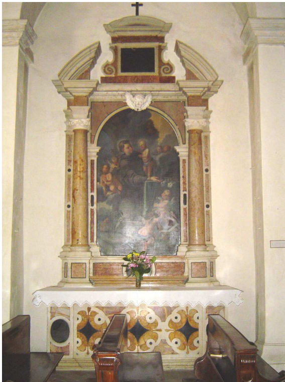
L'Altare di S. Antonio