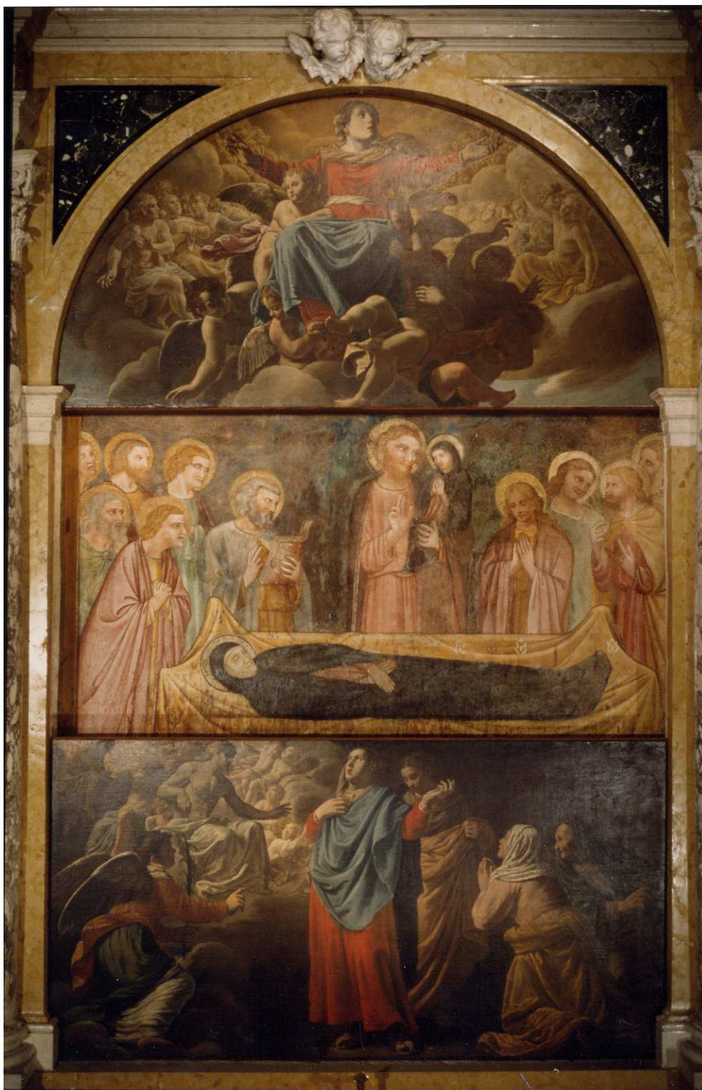
Affresco e pale dell'Altare Maggiore