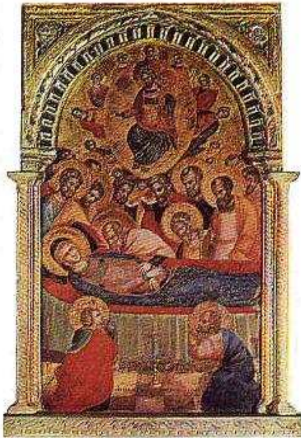
Lorenzo Veneziano: Dormitio Virginis Duomo di Vicenza