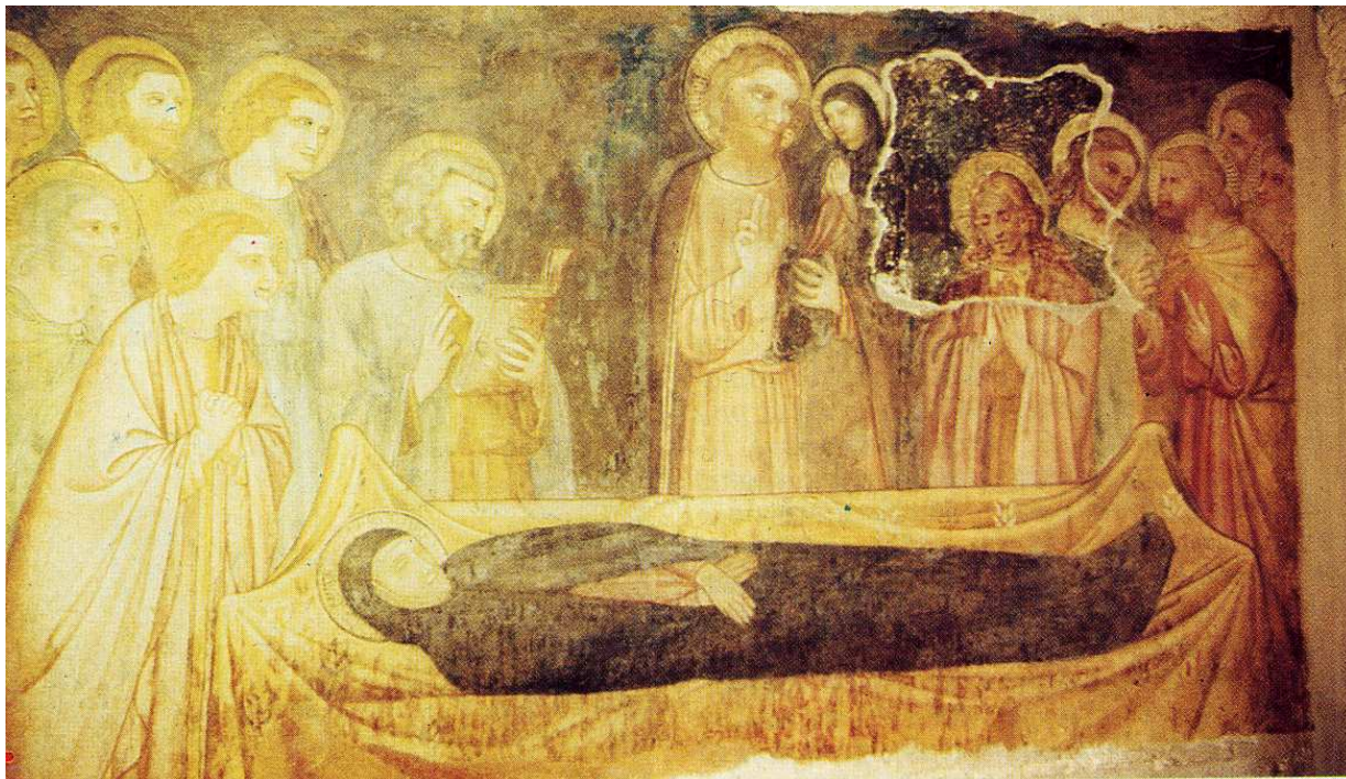
L'affresco durante il restauro, anno 1990 (12)

Le lacune di piccola dimensione sono state integrate con una tempera leggera, facilmente asportabile con acetone e alcool. Infine è stato nebulizzato sulla superficie un sottile strato di vernice per proteggere il dipinto e ristabilire omogeneità di riflessione.