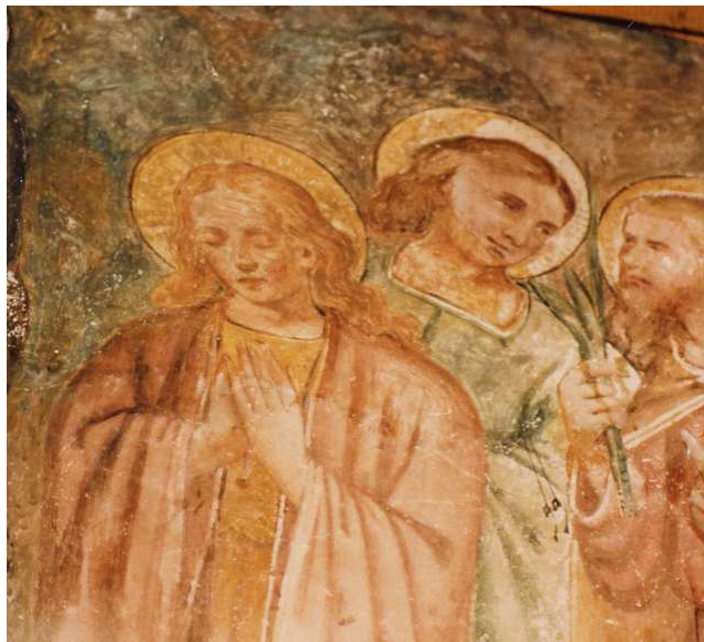
Foto scattata prima del restauro

In base alla tradizione sulla dormizione, la palma è un elemento importante, simbolo di "annuncio" della Morte, portato dall'Arcangelo Michele, come viene descritto nei vangeli apocrifi. Non è quindi facile ritenere che questo elemento non sia originale. Lo troviamo rappresentato dai più grandi pittori: Duccio di Buoninsegna, Vittore Carpaccio, Andrea Mantenga, Ottaviano Nelli, Filippo Lippi, Piero della Francesca, la troviamo nel Coro degli Scrovegni, Iacopo Bellini, Liberale da Verona e in tante altre Dormizioni sparse in tutta l'Italia. (13)