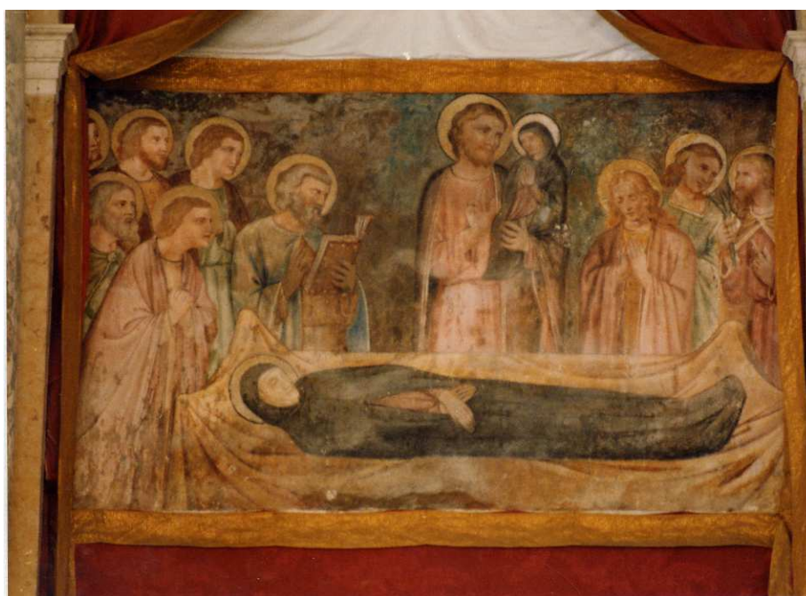
L'affresco prima del restauro

La proposta d'intervento ha mirato ad un recupero estetico dell'opera curandone la manutenzione.