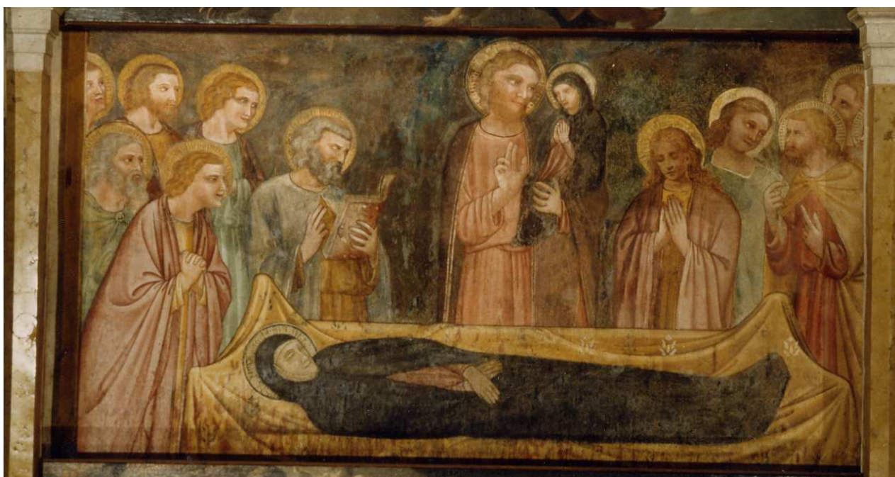
L'affresco dopo il restauro.