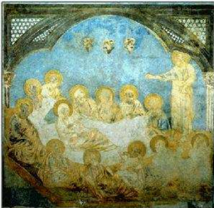
Cimabue: Morte della Madonna Affresco risalente agli anni 1277-1280 Basilica Superiore di S. Francesco, transetto ASSISI (PG)