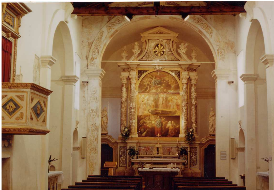
La Chiesa restaurata

I recenti restauri (1991) hanno riportato in luce le fondamenta della Chiesetta medievale. (5)