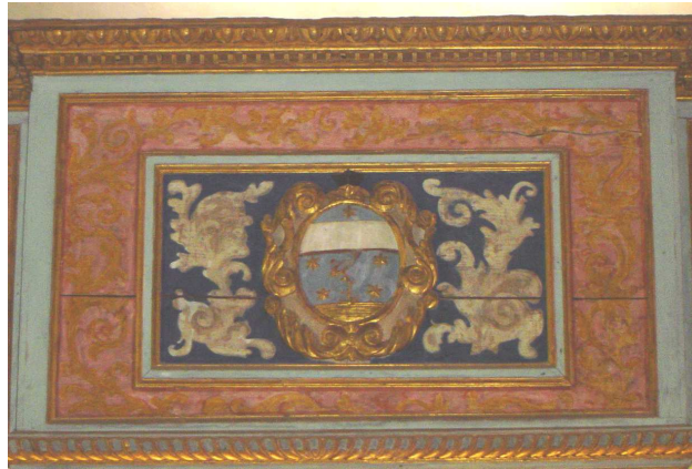
Particolare della Cantoria con stemma.