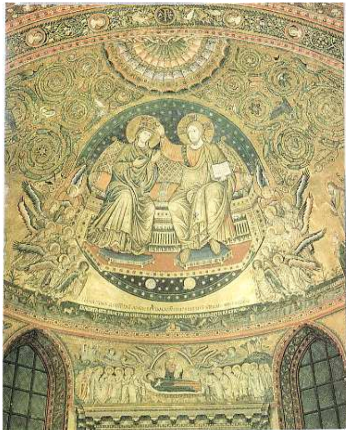
Dormizione e Incoronazione di Maria Vergine Basilica di Santa Maria Maggiore - Roma Mosaico dell'abside, V° secolo